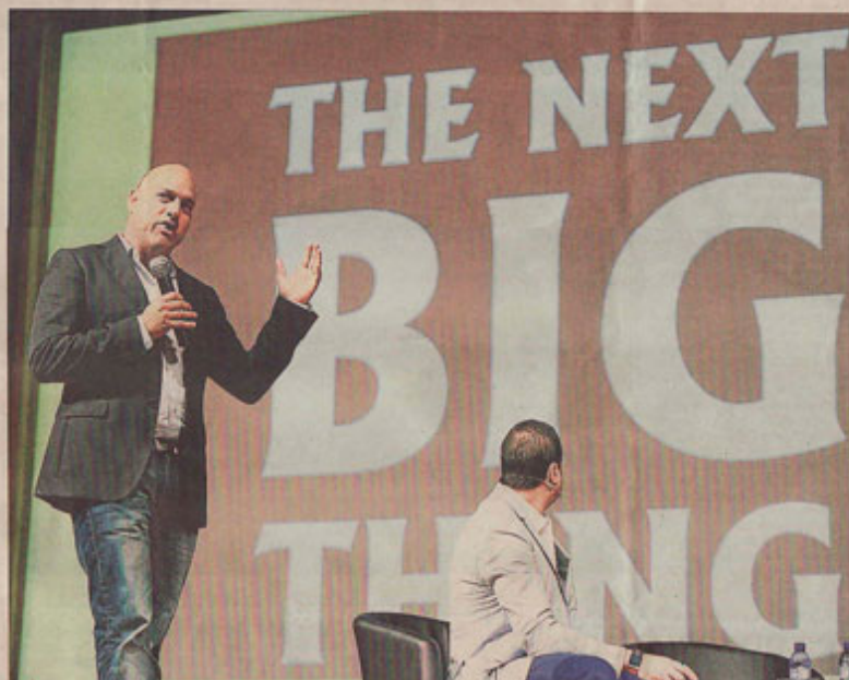
El guru. Salim Ismail, un dels tòtems del món de l'emprenedoria, durant la seva conferència al BizBarcelona

Dimarts, 5 de juny del 2014 LA VANGUARDIA